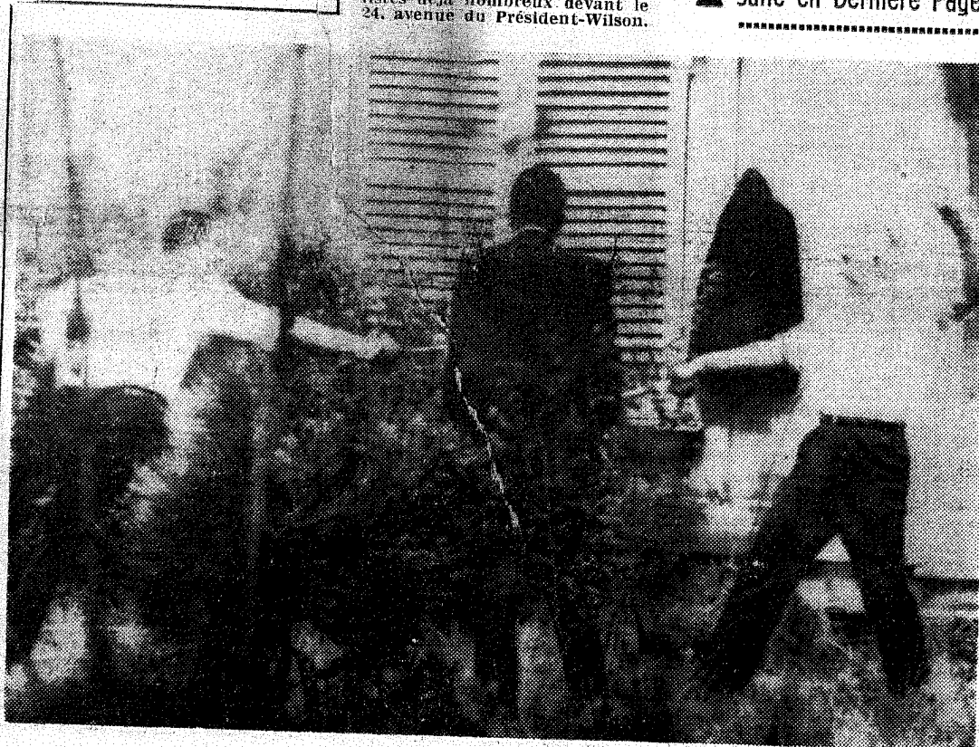
MM. René Ribière (à gauche) et Gaston Defferre, au cours de leur duel dans le jardin d'une maison de Neuilly. De dos, M. Jean Lipkowski, qui dirigeait le combat.