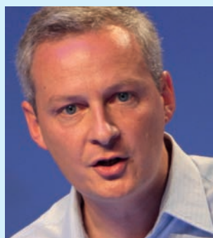
Bruno Le Maire